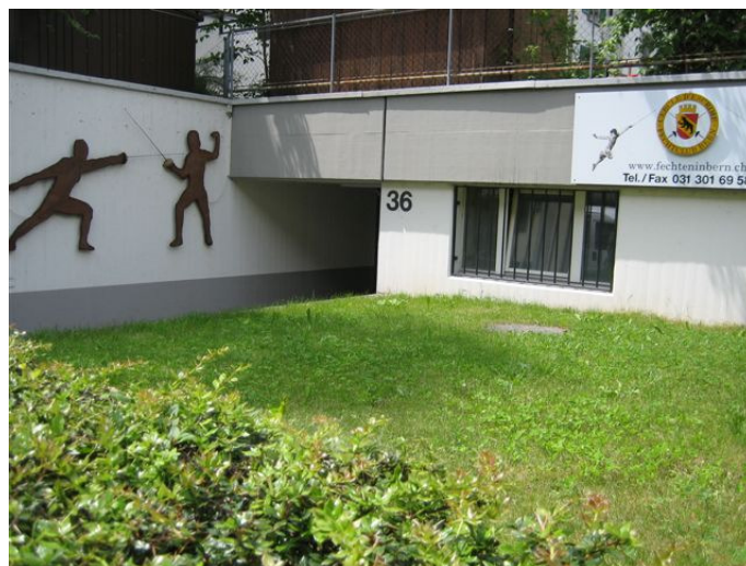
Eingang vom Fechtsaal an der Gewerbestrasse

Seit 2005 führt Antoinette Näf den Verein, der zur Zeit 160 Mitglieder, davon 60 Junioren, zählt. Heute werden beim Lektionieren die Fachbegriffe auf deutsch genannt und es wird ausschliesslich nur noch Degenfechten unterrichtet.